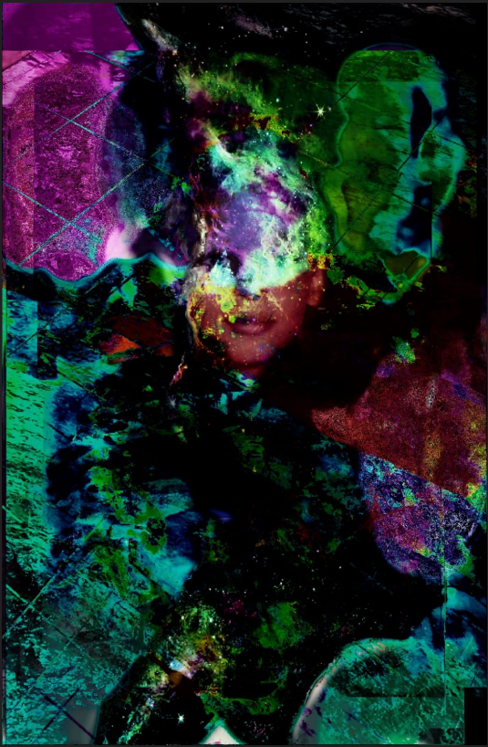
Miragem Arte digital impressa sobre papel Hahnemühle